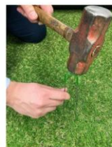
設置に便利なU字杭 2.6本付き