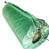
施工や保管などの取り回しに便利なロール状でお届け