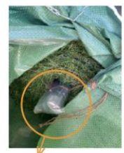
杭は中心紙管内へ収納