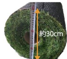
1巻ごと丁寧に手巻き