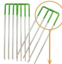
設置後に杭が目立ちにくいグリーン塗装